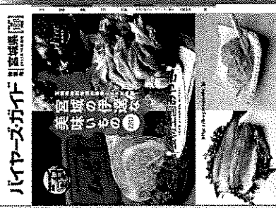
ハイアースガイド 食産業版 美味の宝庫